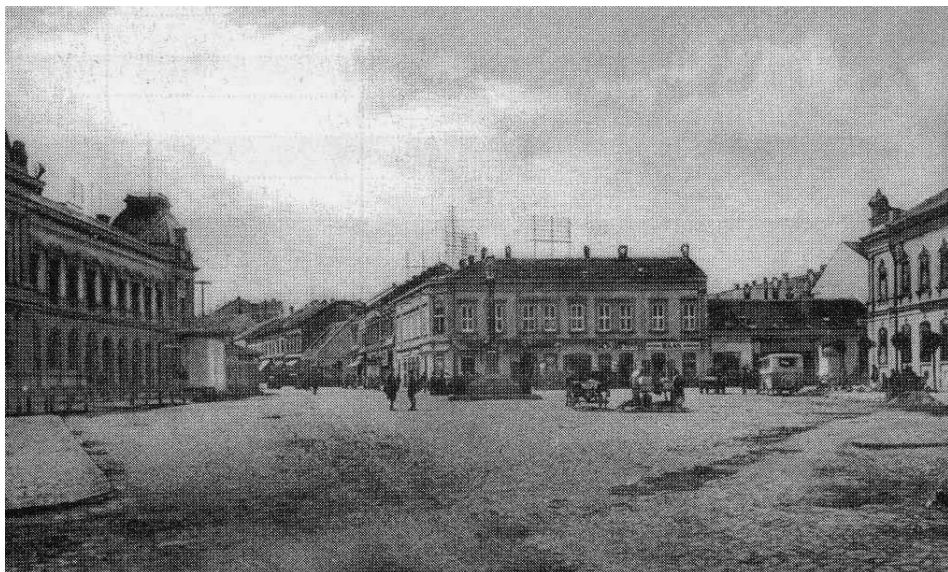
Pohľad na vtedajšie Hlavné námestie z roku 1934 s Hotelom Tatra uprostred – dnes nesie pomenovanie Hotel Dituria.