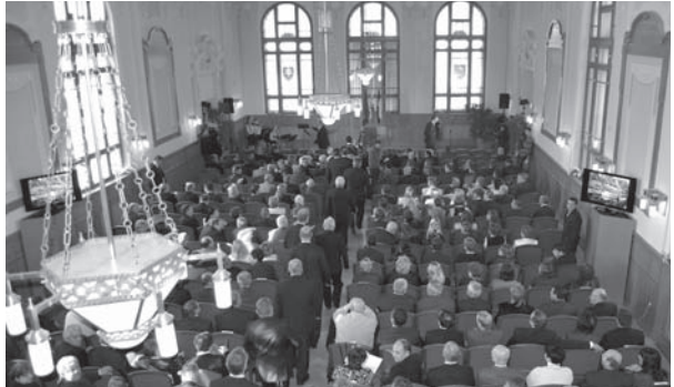
Nová zrekonštruovaná sála Župného domu

Obe sály i ďalšie priestory a miestnosti v tomto kridle historického Župného domu sa rekonštruovali pod dohľadom