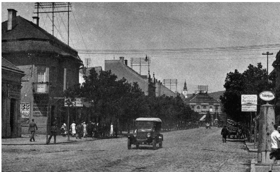
A takýto bol pohľad na vtedajšiu Masarykovu ulicu v roku 1929 a dnešnú Štefánikovu triedu.